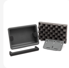
Plateau + diviseur en plastique