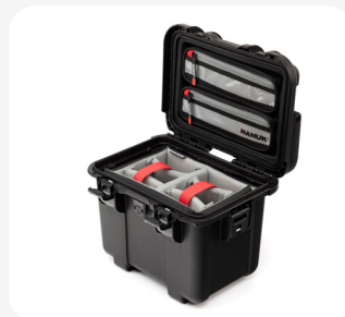
Kit pro photo