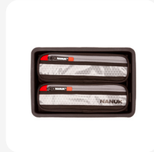
Organisateur de couvercle