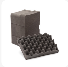
Mousse en cubes