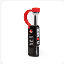
Serrure de boîtier approuvée TSA