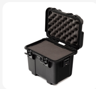
Mousse en cubes