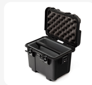
Plateau + diviseur en plastique