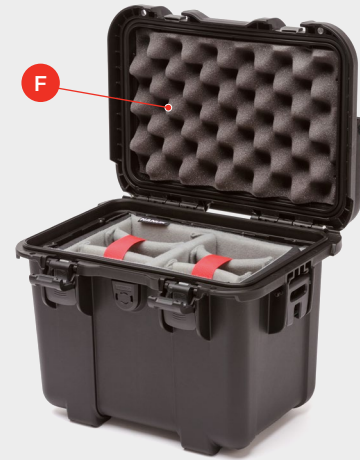
Top View Assembled Vue de dessus assemblée