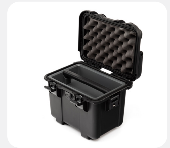
Tray & Rigid Divider Plateau + diviseur rigide