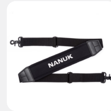
Shoulder Strap Sangle