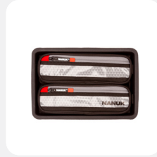
Lid Organizer Organisateur de couvercle