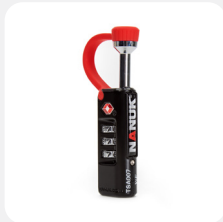
Nanuk TSA Padlock Serrure de boîtier approuvée TSA