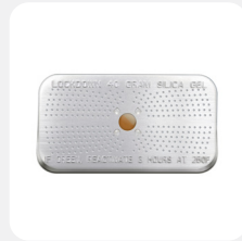
Desiccant Container Conteneur déshydratant