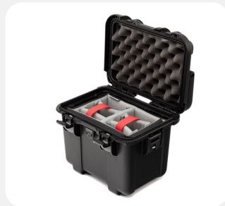
Padded Dividers Diviseurs rembourrés