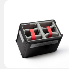
Padded Dividers Diviseurs rembourrés