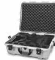
Silver Argent | Plata