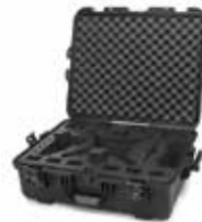
Black Noir | Negro