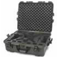
Olive Olive | Oliva