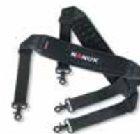
Shoulder Strap Bandoulière Bandolera