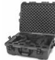
Graphite Graphite | Grafito