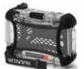
*NANUK NANO 310 Available in 8 colors Disponible en 8 couleurs Disponible en 8 colores