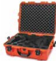
Orange Orange | Naranja