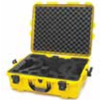
Yellow Jaune | Amarillo