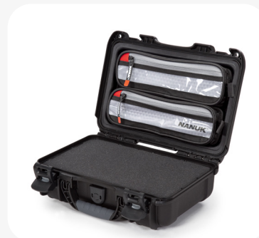
Organisateur de couvercle