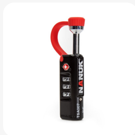
Serrure de boîtier approuvée TSA