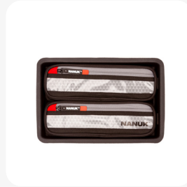
Organisateur de couvercle