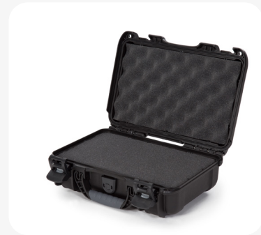
Mousse en cubes