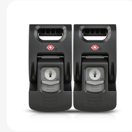
Kit de mise à niveau du loquet TSA